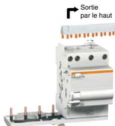
Vigi TG60 (4P)