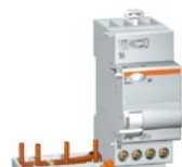
Vigi DT40 (4P)

⚠ L'association disjoncteur-bloc différentiel est conforme à la norme pour les appareils de la même famille et présentés dans le même catalogue Schneider Electric.