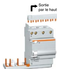
Vigi TG40 (4P)